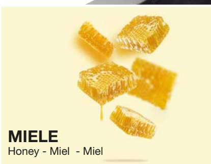
MIELE Honey - Miel - Miel