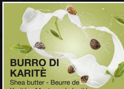
BURRO DI KARITÉ Shea butter - Beurre de Karité - Manteca de karité