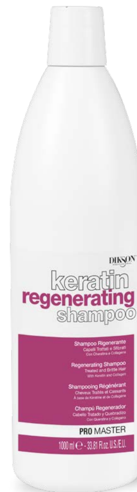
1000 ml code 24004904