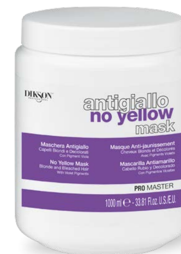
1000 ml code 24004909