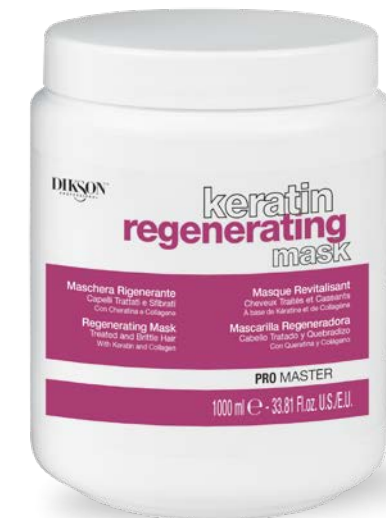
1000 ml code 24004905