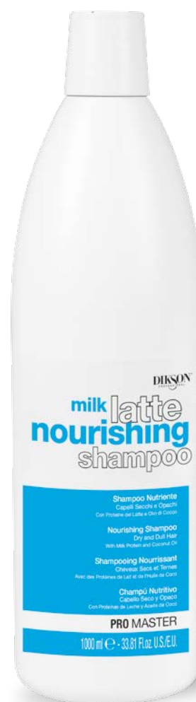
1000 ml code 24004902