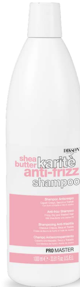
1000 ml code 24004906

Dry and Treated Hair Cheveux Crépus, Secs et Traités Cabello Encrespado, Seco y Tratado