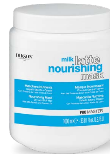
1000 ml code 24004903