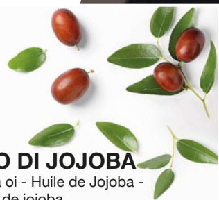
OLIO DI JOJOBA Jojoba oi - Huile de Jojoba - Aceite de jojoba