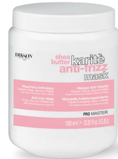
1000 ml code 24004907