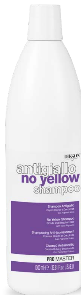
1000 ml code 24004908