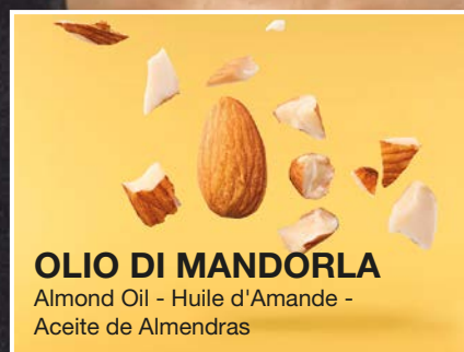
OLIO DI MANDORLA Almond Oil - Huile d'Amande - Aceite de Almendras

MIELE: idrata e nutre in profondità tutta la struttura del capello OLIO DI MANDORLA: le sue proprietà emollienti lo rendono perfetto per i capelli secchi e sfibrati. Ottimo per contrastare il crespo e rendere i capelli morbidi